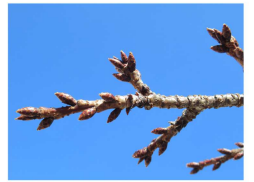
園庭の河津桜。今年はいつ咲くでしょうか