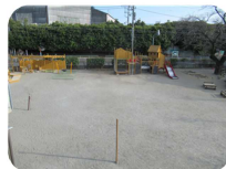
ひろーい園庭で遊びましょう!