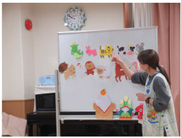
2025年初めての誕生会では干支のお話がありました(3~5歳児)