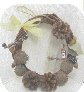
まつぼっくりのリース

細い木の枝に「トトロ」や「まっくろくろすけ」帽子のついているクヌギのどんぐりを並べてみました。木の枝のブランコも作ってみました。