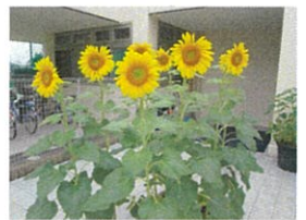
ひまわりが咲きました

ようやく1か月半を超える梅雨期間が終わり、本格的な夏が到来しました。梅雨明けが発表された日の午前中、園庭で遊んでいた幼児クラスの子ども達が「先生！セミの抜け殻があったよ!」と見せてくれました。しばらくすると「ミンミン」と賑やかな鳴き声が聞こえてきました。セミも梅雨明けを待っていたようです。