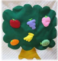
フェルトで作った 「果物の木」 マジックテープが付いています

保育園の乳児クラスで子どもたちが喜んで遊んでいる『手作り玩具』と『わらべうた』を紹介します。