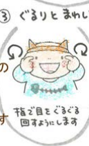
③ ぐるりとまわして

☆おもしろい顔になるので 思わず笑ってしまいます。楽しい気持ち が湧き上がってきます