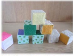
牛乳パックを正方形にして 布とフェルトを貼って作った 積み木