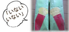
牛乳パックを二つ繋げて作った 「いないいないばあ」