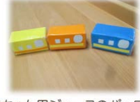
赤ちゃん用ジュースのバックで作った 電車。マジックテープで連結します。