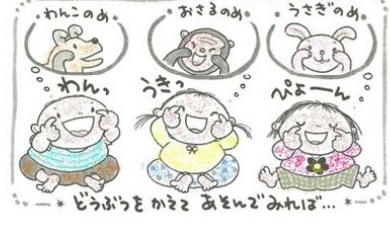
「わーらめ」「おさきめ」「うさきめ」 「わん」「うさ」「ぴん」 「ごうごうとまわしてねこのめ」

今回の給食紹介では、0歳児クラスで赤ちゃんがよく食べる『簡単でおいしい』離乳食を紹介します。家庭で、大人のスープを作る時に取り分けて離乳食用にできます。