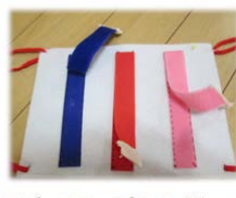
マジックテープを長く貼って 『パリパリ』とはがす感 触を楽しみます