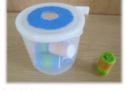
大人気! ペットボトルのキャップでポットン 落とし