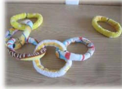
タオルを丸めて縫って、スナップをつけた『輪つなぎ』