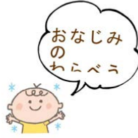
おなじみの わらべうた